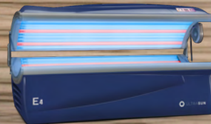
Royal Blue Metallic