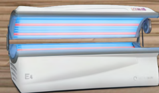
Dream White Metallic