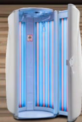
Dream White Metallic