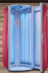
Fancy Red Metallic