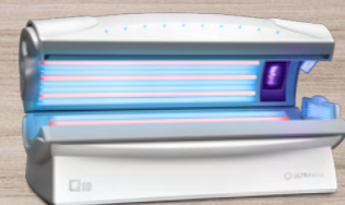
Dream White Metallic