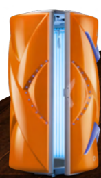
Xtreme Orange Metallic