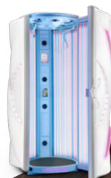
Dream White Metallic