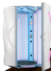
Dream White Metallic