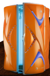
Xtreme Orange Metallic